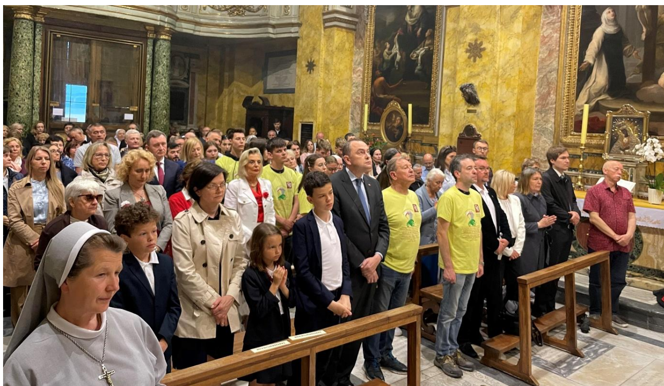
Fot.14. Uczestnicy Mszy Świętej w kościele pw. Sw. Stanisława w Rzymie