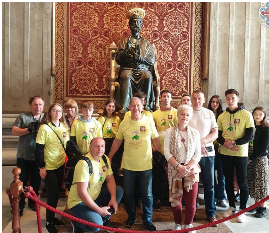
Fot.15. Uczestnicy Rajdokonferencji podczas zwiedzania Bazyliki św. Piotra w Watykanie

4 maja 2023 r. stawiliśmy się w Bazylice św. Piotra, gdzie przy Grobie św. Jana Pawła II o godz. 7.00 rano uczestniczyliśmy w Eucharystii, której przewodniczył abp. Marek Jędraszewski – Metropolita Krakowski w asyście kard. Konrada Krajewskiego - jałmużnika papieskiego oraz ok.70 kapłanów, a w tym wielu biskupów. Eucharystia transmitowana była przez Radio Watykan na cały świat.