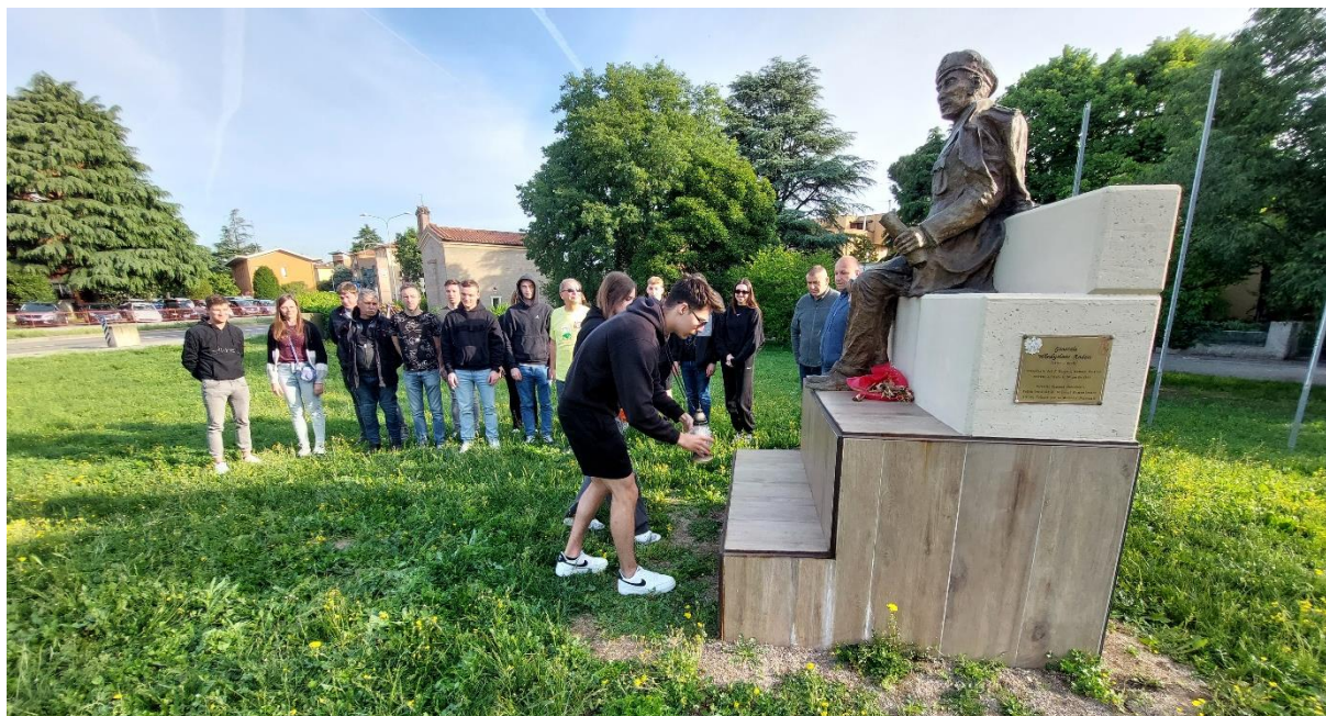
Fot.22. Składanie zniczy pamięci przed Pomnikiem Gen. Władysława Andersa

Jednym z wielu ciekawych odwiedzanych przez nas miejsc był skwer z Pomnikiem Gen. Władysława Andersa słynnego dowódcy II Korpusu Wojska Polskiego oraz Niedźwiadka Wojtka. Wojtek znalazł się w samym centrum walk o Monte Cassino. Pomagał przenosząc ciężkie skrzynie z amunicją artyleryjską. Robił to niezwykle starannie nie upuszczając żadnej z nich. Z tego względu wizerunek misia Wojtka niosącego pocisk stał się wkrótce emblematem jego jednostki. Po zdobyciu Monte Cassino kapral Wojtek wraz z 22. Kompanią brał jeszcze udział w wyzwoleniu Anконы i Bolonii.