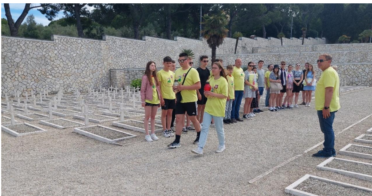
Fot.20. Poczec zniczowy na Polskim Cmentarzu Wojennym w Ankonie

Ankona, kolejny raz przygotowała reprezentantom „Młodej Przyszłości Polskiego Narodu” dobry klimat umożliwiając kąpiel (również nocną) w ciepłej wodzie Adriatyku.