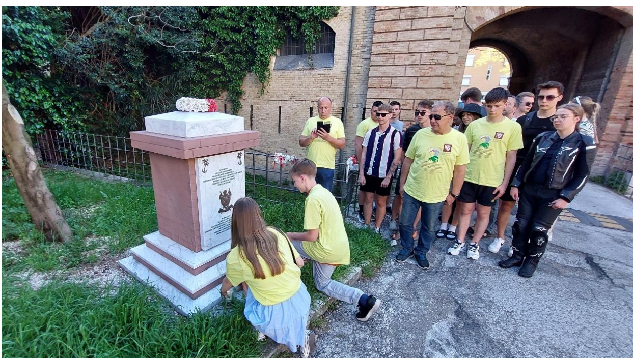
Fot.21. Uczestnicy Rajdokonferencji przed pomnikiem upamiętniającym polskich żołnierzy, którzy wyzwolili Ankonę