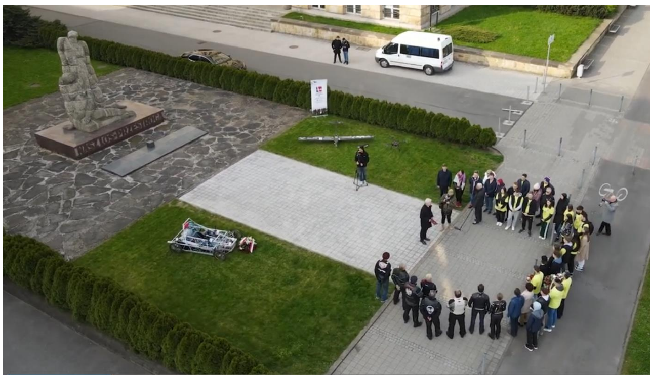
Fot.1. Uroczyste rozpoczęcie VII Polskiego Rajdu Ekologicznego z Konferencją Naukową Vehicles of The Future na Kampusie Politechniki Wrocławskiej przed Pomnikiem Pomordowanych Profesorów Lwowskich