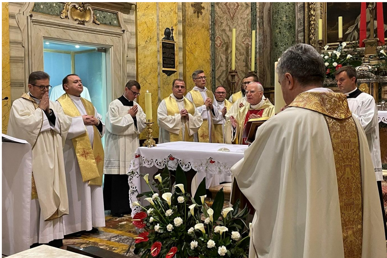
Rys.13. Koncelebranci Mszy Świętej w polskim kościele pw. Św. Stanisława w Rzymie