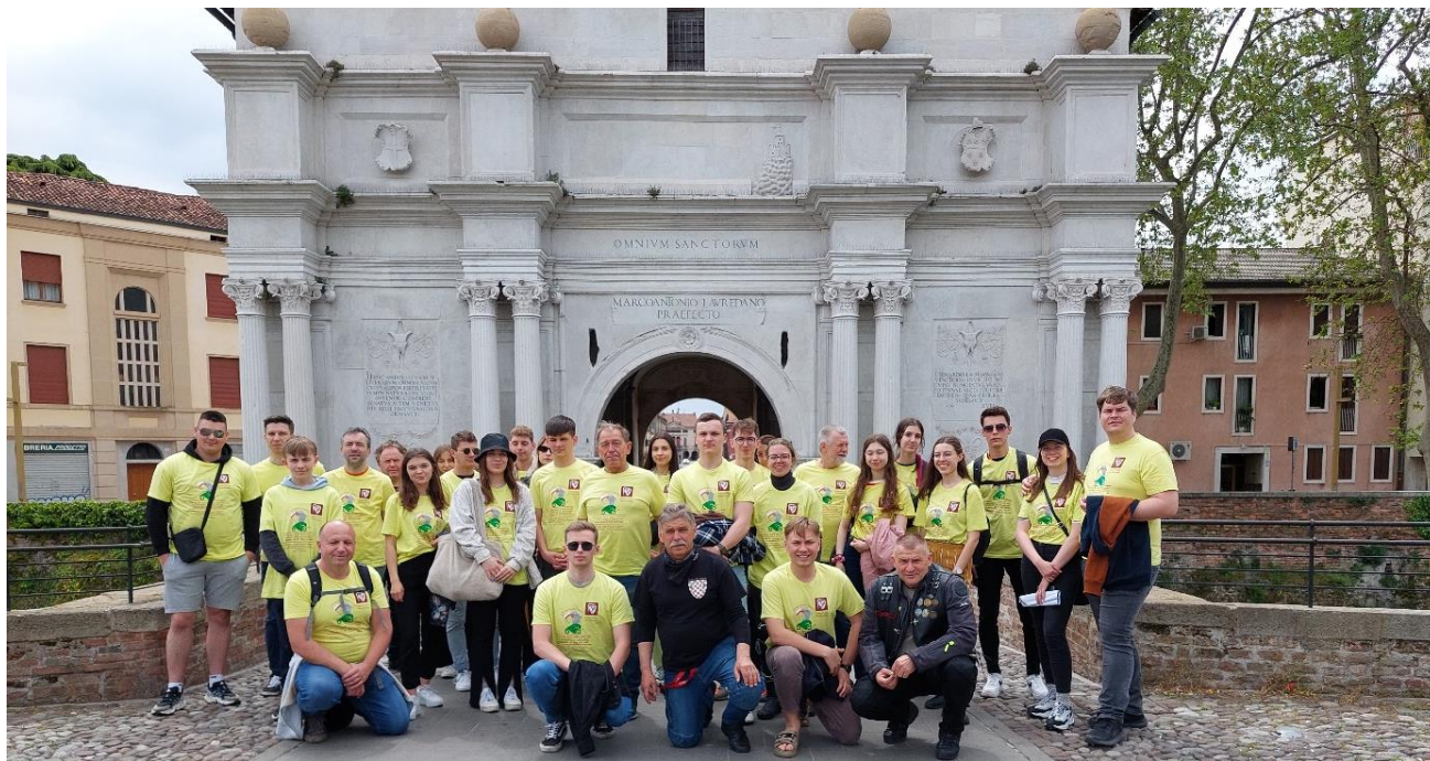
Fot.9. Uczestnicy Rajdokonferencji na tle bramy prowadzącej do miasteczka uniwersyteckiego w Padwie

Na uniwersytecie tym studiował m.in. Mikołaj Kopernik, który „ Wstrzymał Słońce, ruszył Ziemię, Polskie go wydało plemię ”, a także Józef Struś, który po studiach obroniwszy również tam doktorat został jego prorektorem, a następnie po wydaniu „ Nauki o tężnie ” w Bazylei, został uznany najsłynniejszym lekarzem nie tylko w Europie, a po dziś dzień zwany „Ojcem medycyny Polskiej”.