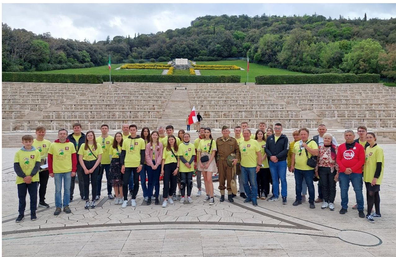
Rys.12. Rajdokonferencja na Polskim Cmentarzu Wojennym na Monte Cassino we Włoszech

Na Cmentarzu tym szczególnie dumnie zabrzmiał śpiewany przez nas Hymn Narodowy oraz pieśń pt. ”Czerwone maki na Monte Cassino” .