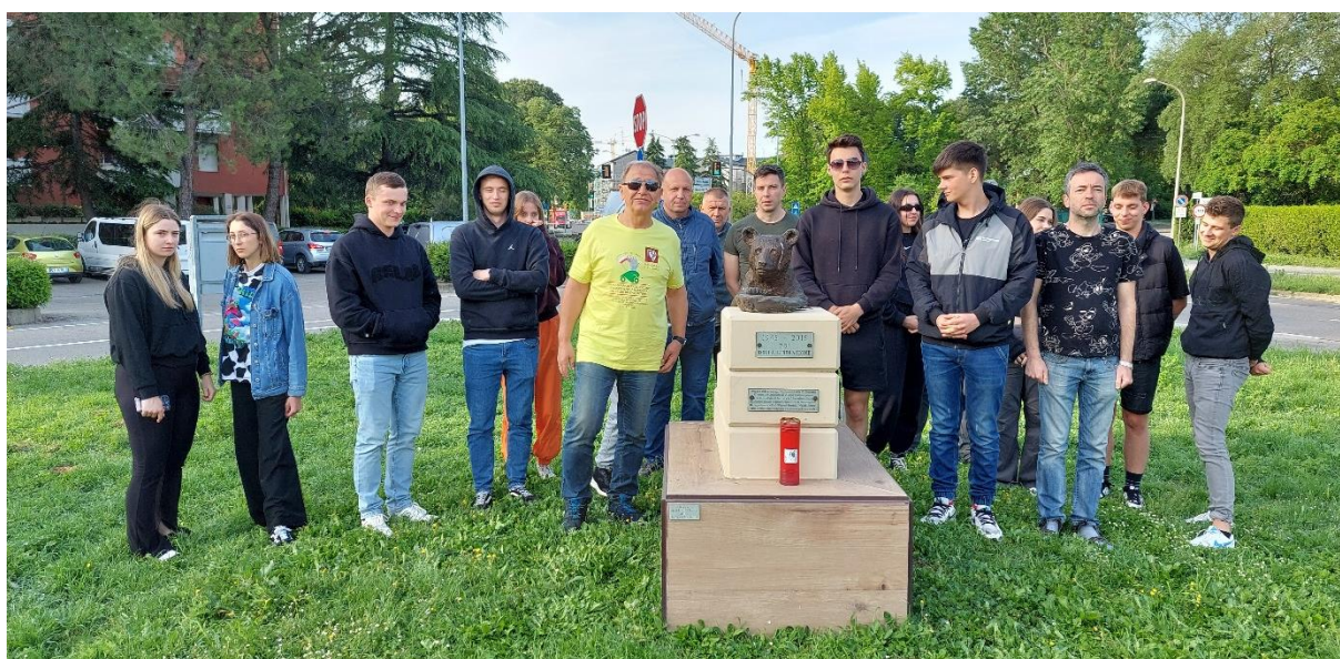
Fot.23. Przy Pomniku Niedźwiadka Wojtka

Wiosną 1945 roku korpus, dowodzony już przez generała Zygmunta Szyszko-Bohusza, wziął udział w ofensywie Sił Sprzymierzonych, która zakończyła się zdobyciem przez Polaków Bolonii, co miało decydujące znaczenie dla klęski Niemców na froncie włoskim. Rankiem 21 kwietnia 1945 r. jako pierwsze weszły do Bolonii pododdziały 9 Batalionu Strzelców Karpackich. Dwie godziny później do miasta wjechały amerykańskie czołgi. Polacy byli serdecznie witani przez mieszkańców Bolonii. Miejscowa ludność spontanicznie wywiesiła białe – czerwone flagi, podkreślając zasługi swoich wyzwolicieli.