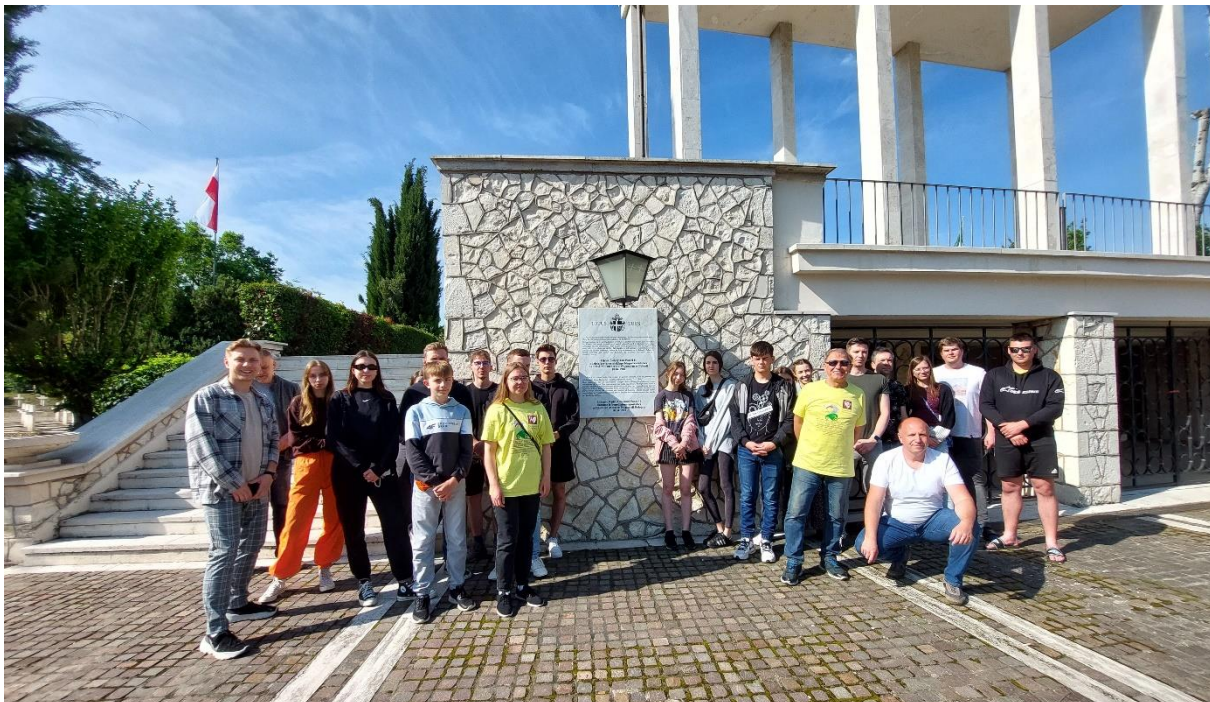
Fot.24. Na Polskim Cmentarzu Wojennym w Bolonii

Kolejnego, 10 dnia Rajdokonferencji w Dachau k. Monachium w Niemczech oddaliśmy hołd Polakom zamordowanym w tym obozie koncentracyjnym składając wieniec, znicze pamięci i śpiewając Hymn Polski.