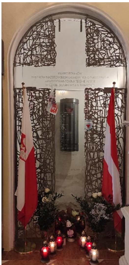
Fot.8. Kahlenberg, Pomnik Króla Jana III Sobieskiego oraz tablica upamiętniająca Pomordowanych Polaków w ok. 100 obozach koncentracyjnych rozlokowanych w czasie II wojny światowej na terenie Austrii