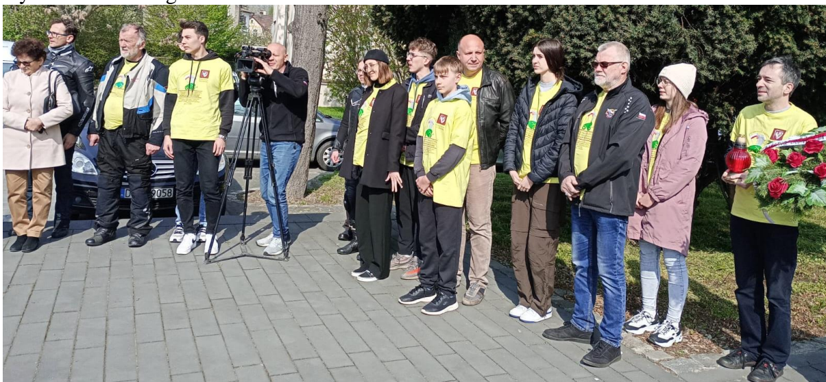
Fot.3. Uczestnicy Rajdokonferencji przygotowujący się do złożenia wieńca przed Pomnikiem Stulecia Niepodległej