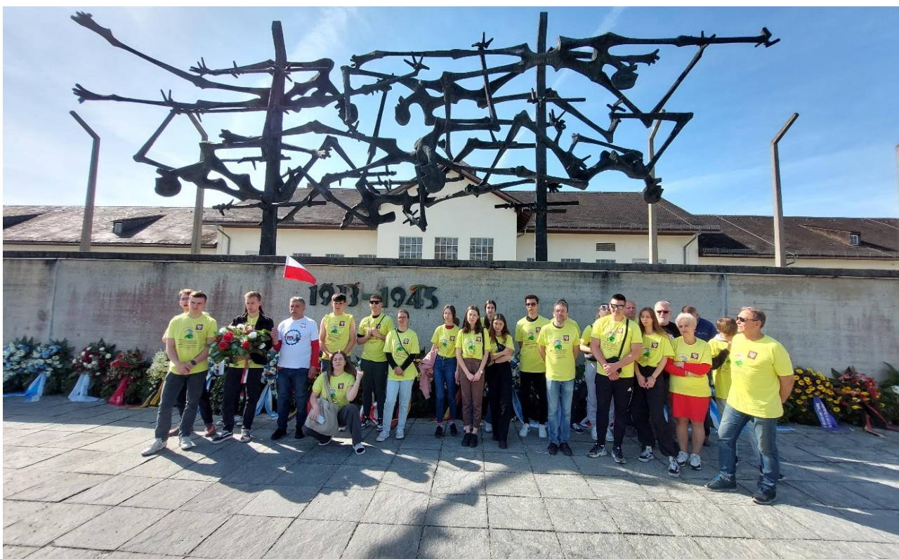
Fot.25. Uczestnicy VII Polskiego Rajdu Ekologicznego z Konferencją Naukową Vehicles of The Future na terenie Obozu Koncentracyjnego Dachau k. Monachium

Obóz wykorzystywany był w celu eksterminacji głównie polskiej inteligencji, a tym przede wszystkim księża katolickich. Na szczególną uwagę zasługuje bulwersujący fakt, że pomimo zdecydowanie najwyższego udziału Polskich Ofiar wśród więzionych podczas II Wojny Światowej, nie ma napisów w języku polskim (jest po żydowsku, angielsku, francusku, niemiecku i rosyjsku)!