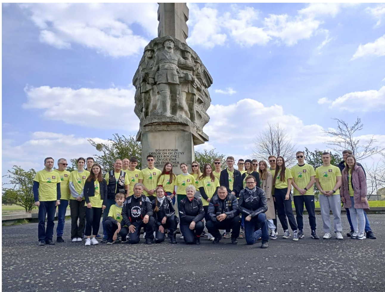
Fot.5. Pomnik Bohaterów Bitwy pod Moką

Przed Pomnikiem Bohaterów Bitwy pod Moką po krótkim wykładzie okolicznościowym złożyliśmy okolicznościowy wieniec oraz znicze pamięci.