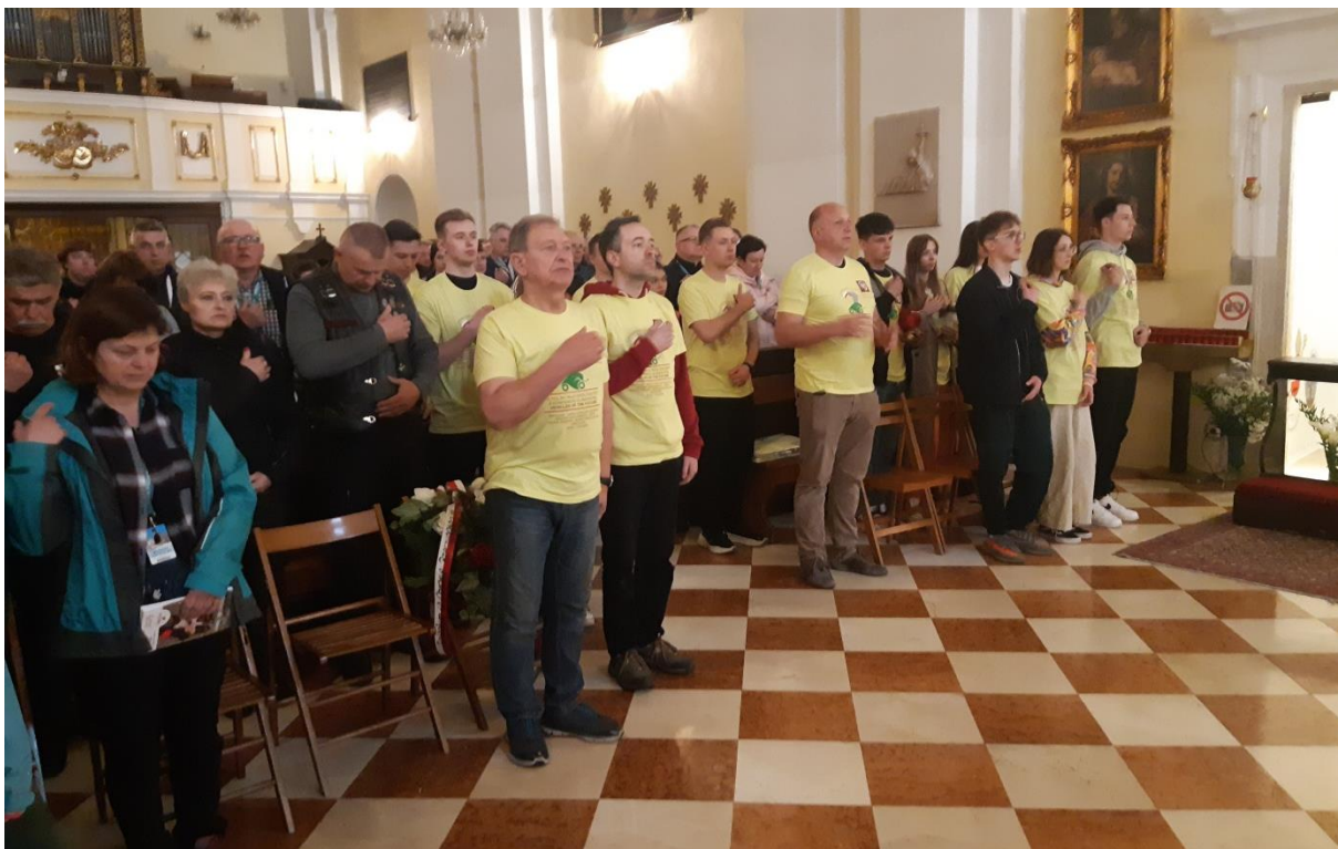
Fot.7. Uczestnicy Rajdokonferencji podczas Mszy Świętej w polskim kościele na Kahlenbergu (Wiedeń)